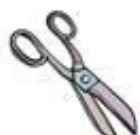
Die Schere قیچی