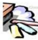
Die Kreide گچ