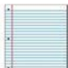
Das Papier کاغذ