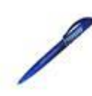
Der Kuli خودکار