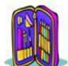
Das Mäppchen جا مدادی