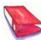
Der Ordner زونکن