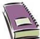
Das Buch کتاب