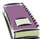
Das Buch کتاب