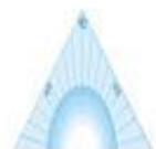
Das Dreieck گونیا