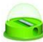
Der Spitzer مداد تراش