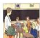
Die Klasse کلاس درس