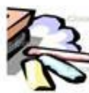
Die Kreide گچ