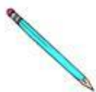
Der Bleistift مداد