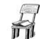
Der Stuhl صندلی