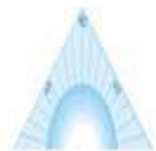
Das Dreieck گونیا