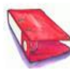
Der Ordner زونکن