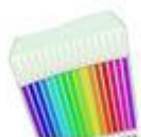
Der Buntstift مداد رنگی