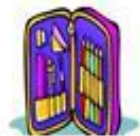
Das Mäppchen / penál