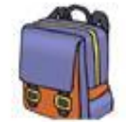
Die Schultasche / školní aktovka