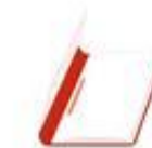
Die Mappe / desky