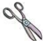
Die Schere / nůžky