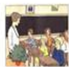
Die Klasse / třída