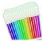
Der Buntstift / barevná fixa