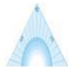
Das Dreieck / trojúhelník