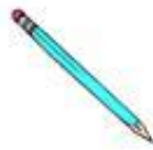
Der Bleistift / tužka