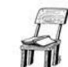
Der Stuhl / židle